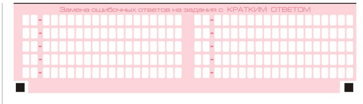
Рис. 8. Область замены ошибочных ответов на задания с кратким ответом

В нижней части бланка ответов № 1 предусмотрены поля для записи исправленных ответов на задания с кратким ответом взамен ошибочно записанных (рис. 8).